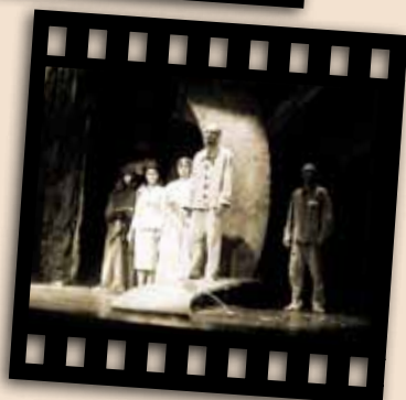
«Альпийская баллада» на «Рождественском параде»